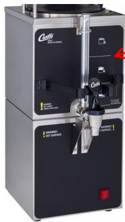
専用コンテナとの組み合わせ