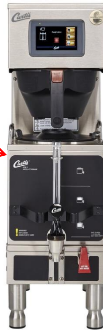
G4 Gemini Single (200V)