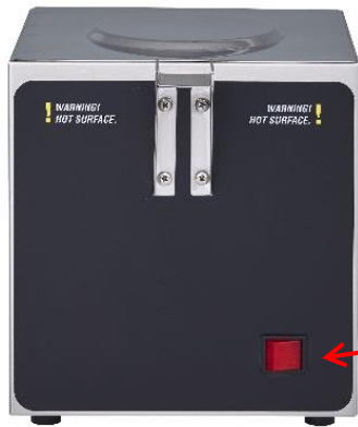
ウォーマースタンド (100V)