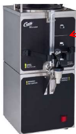
専用コンテナとの組み合わせ