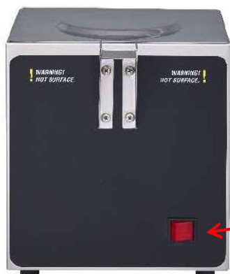
ウォーマースタンド (100V)