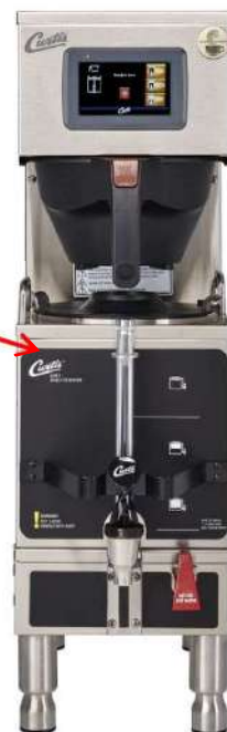
Gemini Single (20)